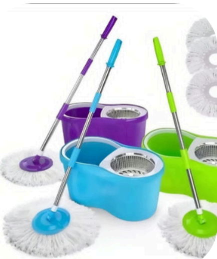
MOPA CENTRÍFUGA ECONOMICA $28900