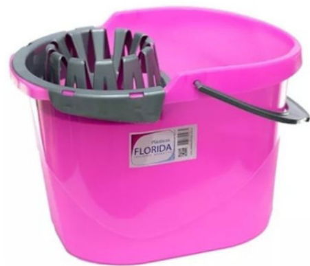
BALDE MOPEROS FLORIDA $13.890