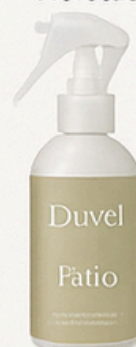
Bergamata y Cedro