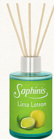
Pera y durazno