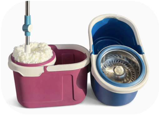
MOPA CENTRÍFUGA PREMIUM $39.900