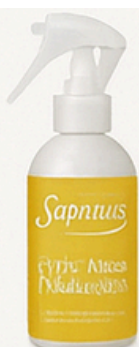
Limon Duice y Vainilla