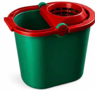
BALDES MOPEROS MATRIPLAST $13.440